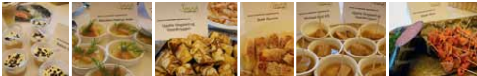
Billederne herover er fra Åbent Hus på Mercantec i efteråret 2009, hvor faglærere og elever tilberedte skønne, nye retter af mange spændende råvarer fra Viborg-egnens Fødevarer-netværk. Nogle af opskrifterne til disse retter kan du se i opskrifthæftet i midten af denne folder.