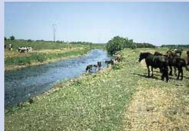
Gudenå og Trækstien mellem Bjerringbro og Tange Sø

Brusgårds Produktionshøjskole har i de sidste år udsat laks i