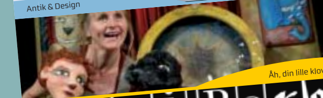
Åh, din lille klovn