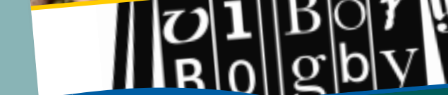
Viborg Bogby 2010