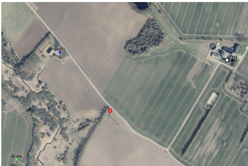
Bilag 1: Ej målsat, rød cirkel markerer boring