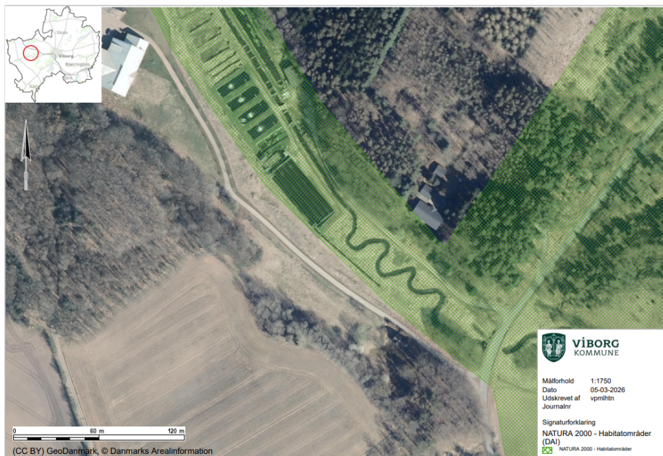
Figur 4: Oversigtskort med angivelse af Natura 2000 område nr. 39 Mønsted og Daugbjerg Kalkgruber og Mønsted Ådal, markeret med grøn.