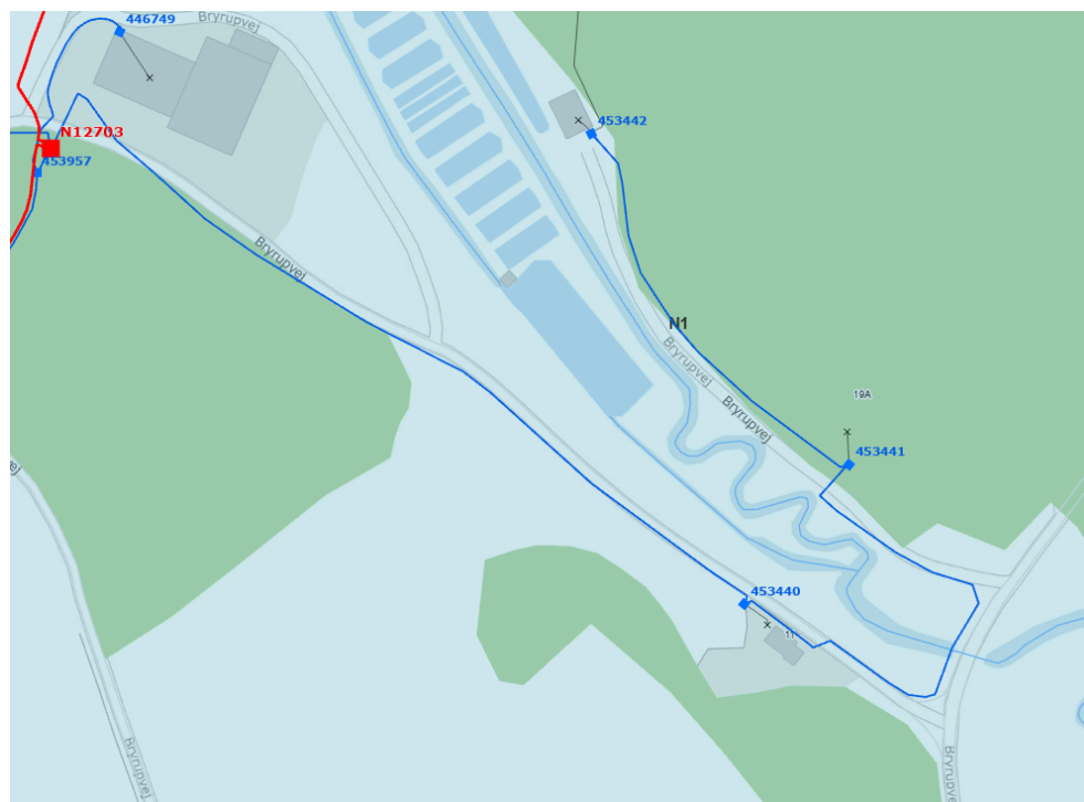
Figur 2: Placering af det nuværende kabel indsendt af ansøger. Det nye kabel kommer til at ligge ved siden af.