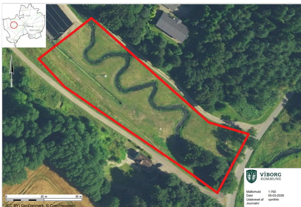
Figur 5: Luftfoto sommer 2015. Vegetationen er lav og ensformig i farve og udtryk, hvilket indikerer, at naturen stadig er ved at etablere sig efter restaureringen i 2012.