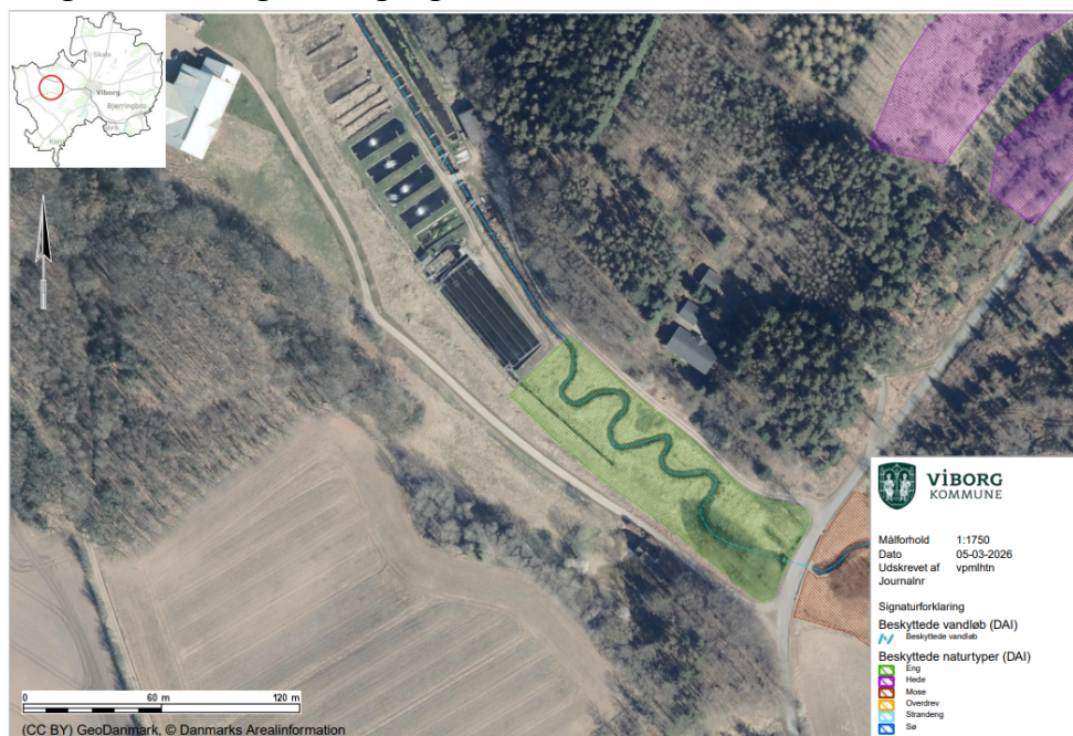
Figur 3: Oversigtskort med angivelse af beskyttet natur. Grøn skravering viser beskyttet eng og den blå streg markerer det beskyttede vandløb Mønsted Å.