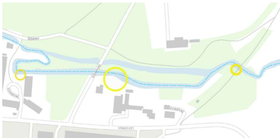
Figur 2. Oversigtskort for projektområdet med styret underboring og ny pumpestation/nyt udløb