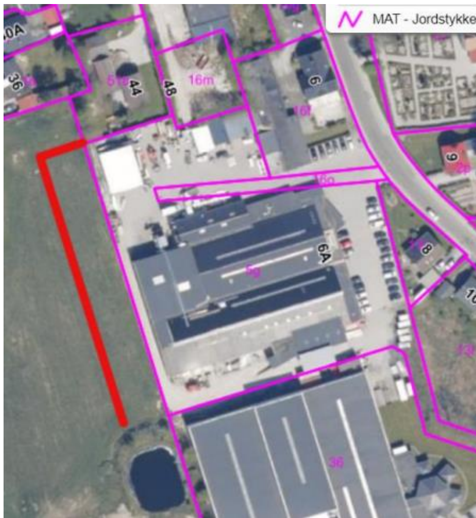
Jordvold skitseret med rød linje.