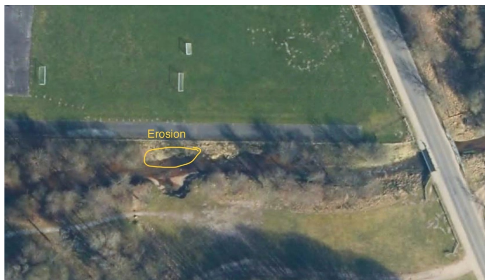
Figur 2: Oversigtskort med angivelse af løbebane og placering af brinkskred.