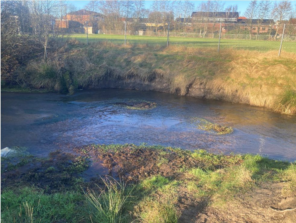
Figur 3: