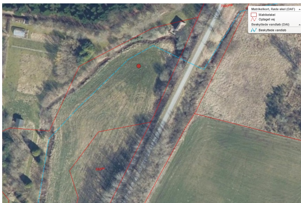
Ortofoto forår 2023: Rød linje: Matrikelskel. Gulgrøn linje: Markblok. Blå stiplede linje: Tracé for beskyttet vandløb.

Tolkning: Vandløbet fortsat forlagt op til ca. 15 meter mod nordvest. Marken høslættes.