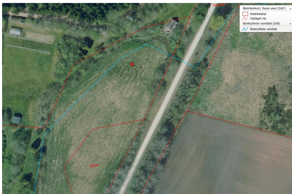
Ortofoto sommer 2022: Rød linje: Matrikelskel. Lyseblå stiplede linje: Tracé for beskyttet vandløb.

Tolkning: Vandløbet fortsat forlagt op til ca. 15 meter mod nordvest. Marken høslættes.