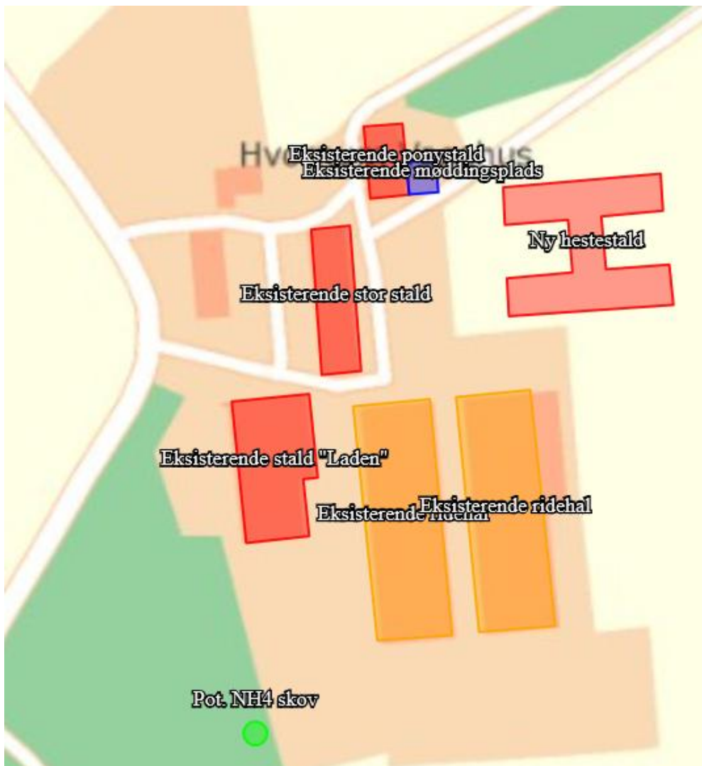
Figur 1. Produktionsarealer.