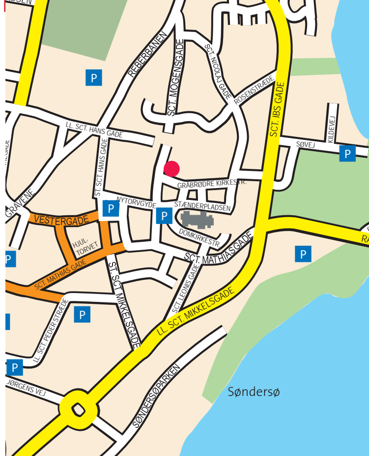
Hans Tausens Minde, Gråbrødre Kirke Stræde 1, 8800 Viborg

Hvor kirken lå, blev der i 1836 anlagt et haveanlæg, der blev indviet i anledning af reformationens 300 års jubilæum med opstilling af en mindestøtte for Hans Tausen, udført af billedhugger H. E. Freund fra København.