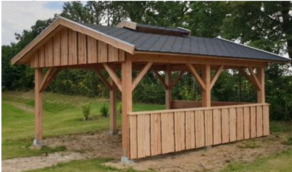
Indsendt af ansøger.