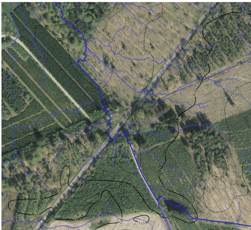
Figur 2: Rørunderføringen ønskes etableret, da Trafik og Vej har udfordringer med vand på vejen. Vandet på vejen skyldes den naturlige afstrømningsvej ifølge analyser fra SCALGO Live, et avanceret hydrologisk analyseprogram. Programmet anvender detaljerede topografiske data til at identificere og visualisere vandstrømningsveje samt potentielle oversvømmelsesområder. De blå streger i figuren angiver de kortlagte strømningsveje, hvor en kraftigere blå farve indikerer en højere forventet vandgennemstrømning.