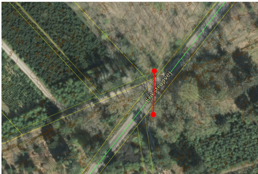
Figur 1: Angivelse og markering af hvor den nye rørunderføring under Erikstrupvej ønskes etableret. De to runde cirkler angiver vejbrønde på begge sider af vejanlægget.

Terrænreguleringen skal derfor behandles efter vandløbsloven, da projektet ændrer vandets frie løbe og nu føres i et styret forløb.