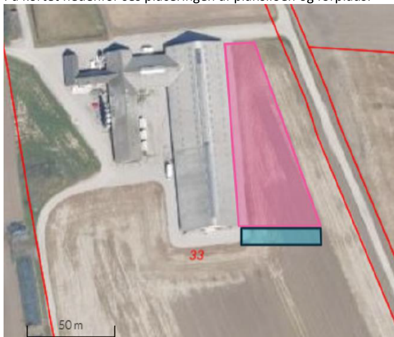
Figur 1 Oversigtskort med den planlagte siloplads (lyserød) og det nye køreareal (blåt)

På kortet nedenfor ses placeringen af plansiloen og forplads: