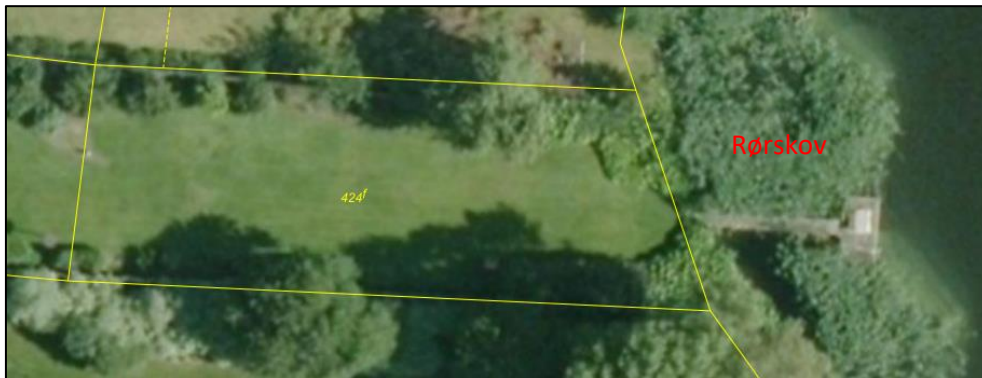
Luftfoto sommer 2012. Fortsat samme bro. Rørskoven omkring broen er groet til.