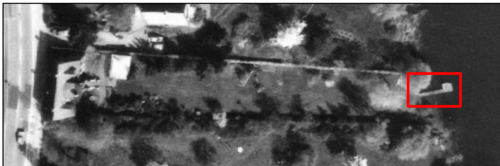
Flyfoto 1990. Der har været en bro ved ejendommen forud for naturbeskyttelseslovens ikrafttræden i 1992. Broen er etableret primo 1980'erne.