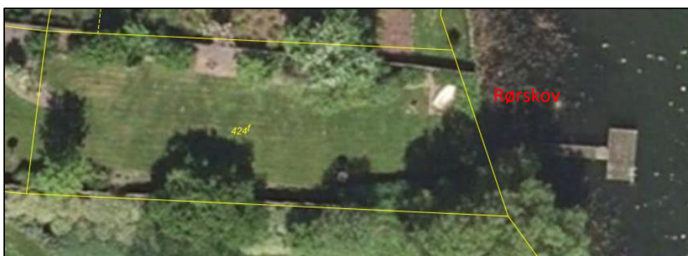
Luftfoto sommer 2008. Fortsat samme bro. Der er ryddet en bræmme af rørskov omkring broen.