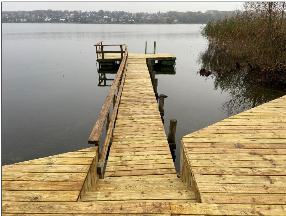
Foto af broen ved kommunens tilsyn den 25. oktober 2024. Heraf ses at broen er opført i forlængelse af træterrasse langs søbredden. Denne afgørelse vedrører ikke terrassen.