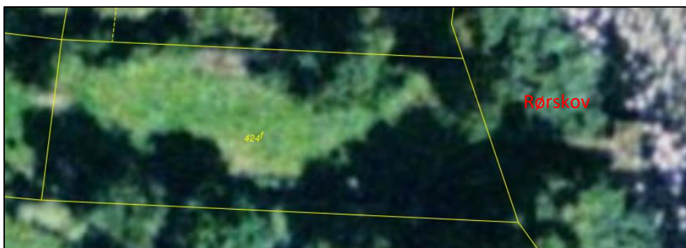
Luftfoto sommer 2004. Fortsat den samme bro. Der er rørskov omkring broen.