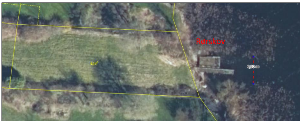
Luftfoto forår 2023. Fortsat samme bro. Platformen er taget ind til søbredden og ligger nord for broen. Den ryddede bræmme af rørskov omkring broen er opmålt til en bredde på 7 meter.