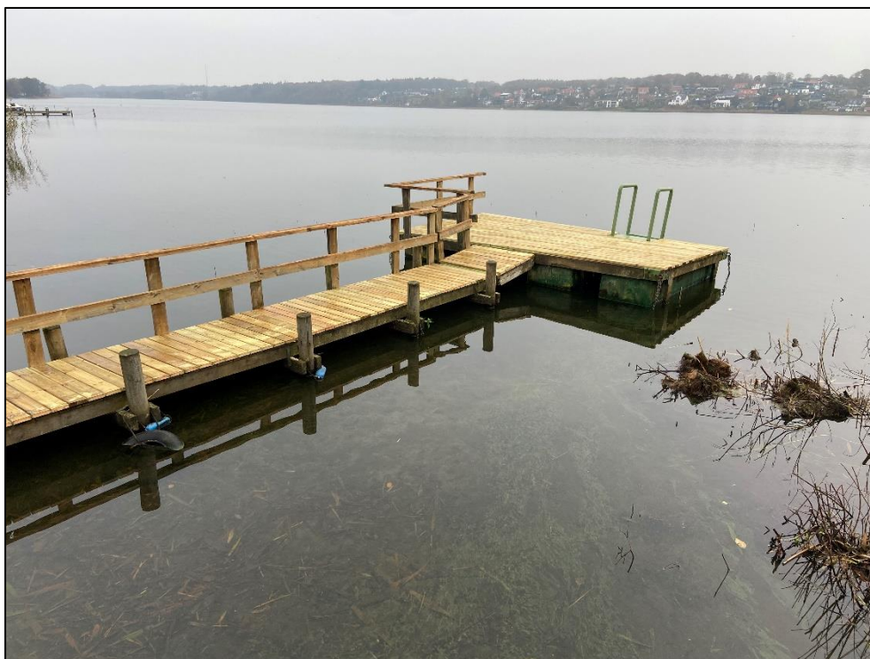
Foto af broen ved kommunens tilsyn den 25. oktober 2024. Heraf ses at trædækket på broen og platformen er nyt (lyst træ), mens det øvrige træværk – bro piller og rækværk samt øvrigt fundament – er af ældre karakter.