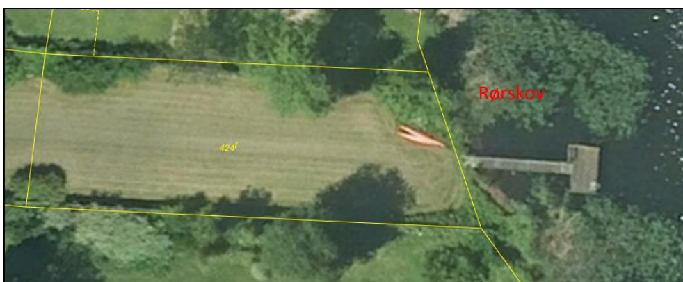
Luftfoto sommer 2018. Fortsat samme bro. Der er ryddet en bræmme af rørskov omkring broen.