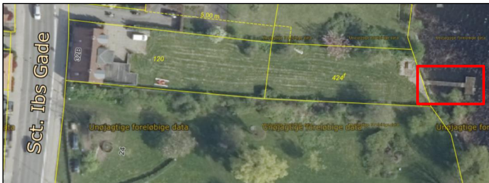
Kort over matr.nr. 424f Viborg Markjorder, hvor broen som lovliggøres er angivet med rød firkant. Ortofoto forår 2024 © Klimadatastyrelsen.

Broen er 12 meter lang og 1,5 meter bred. Platformen for enden af broen er 3 x 5 meter. Broen og platformen har rækværk langs den nordlige side, og der er monteret en badestige for enden af platformen.