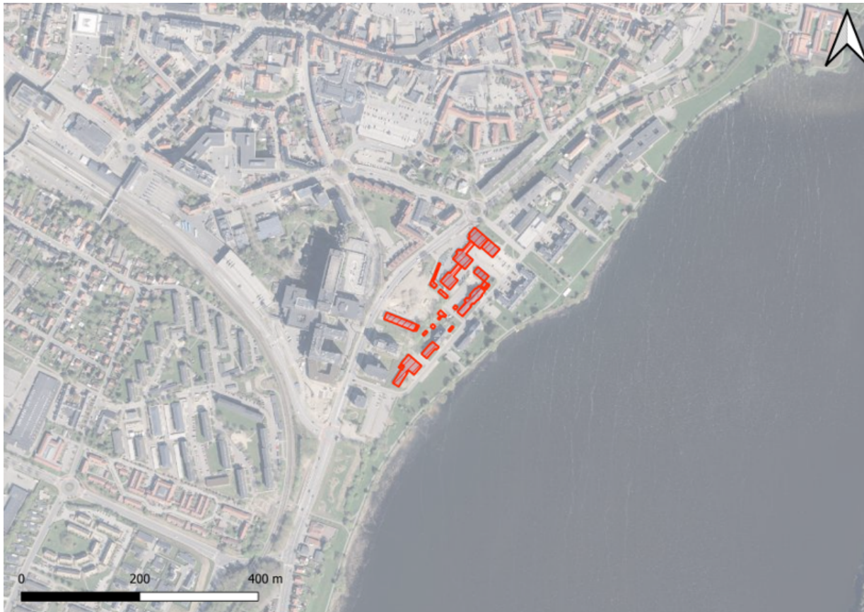
Oversigtskort ej målfast