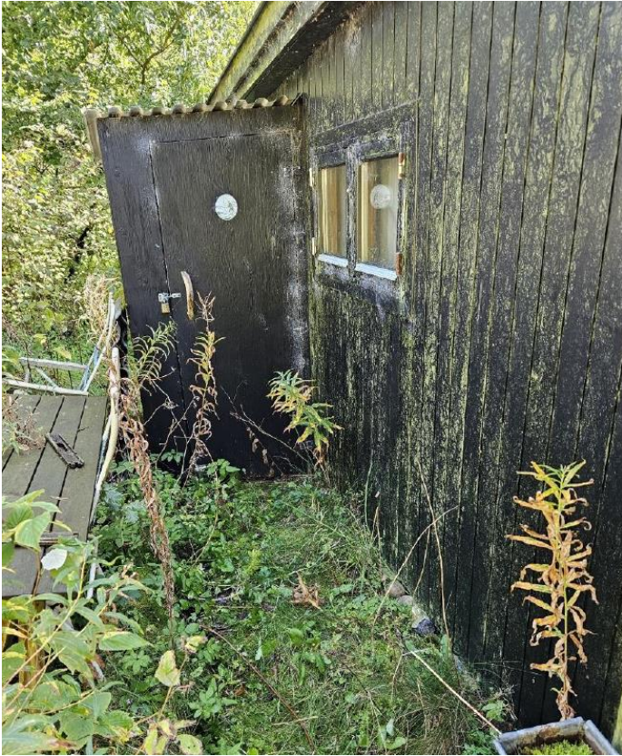
Foto 3 Udvendig koste- og værktøjsskab.