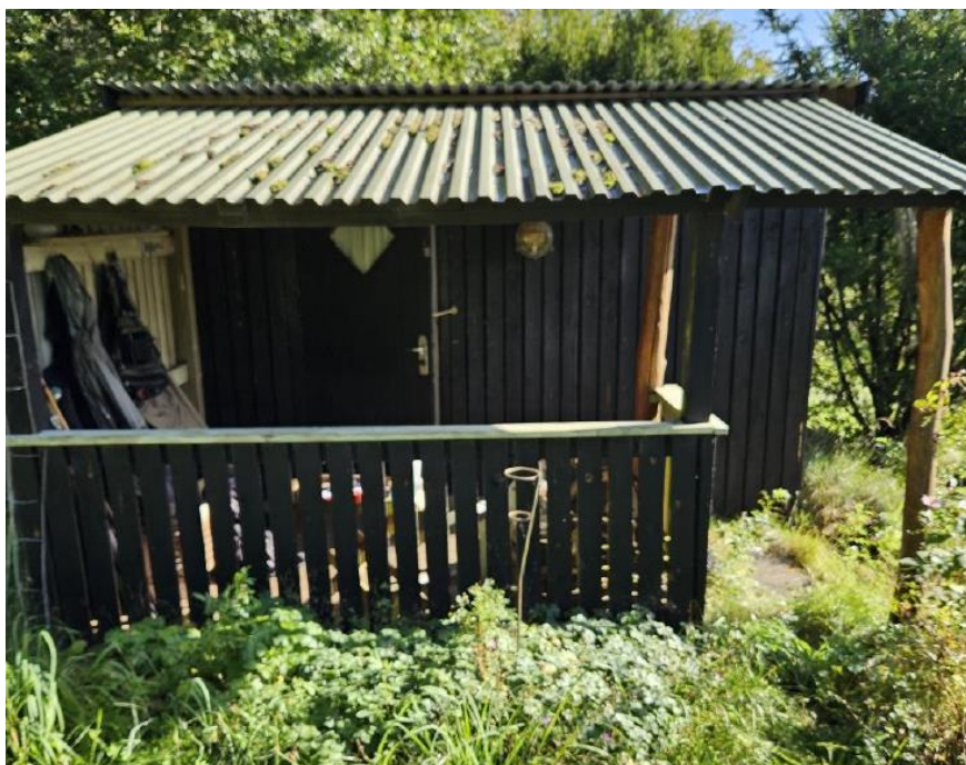
Foto 1 Åbent vindfang.

Ansøgers foto af annekset set udefra er indsat nedenfor.