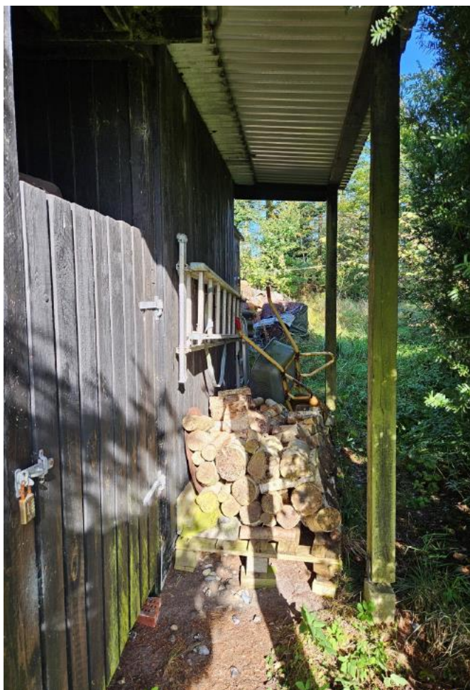
Foto 2 To-tredjedel tremmelåg samt 7 tagudhæng.