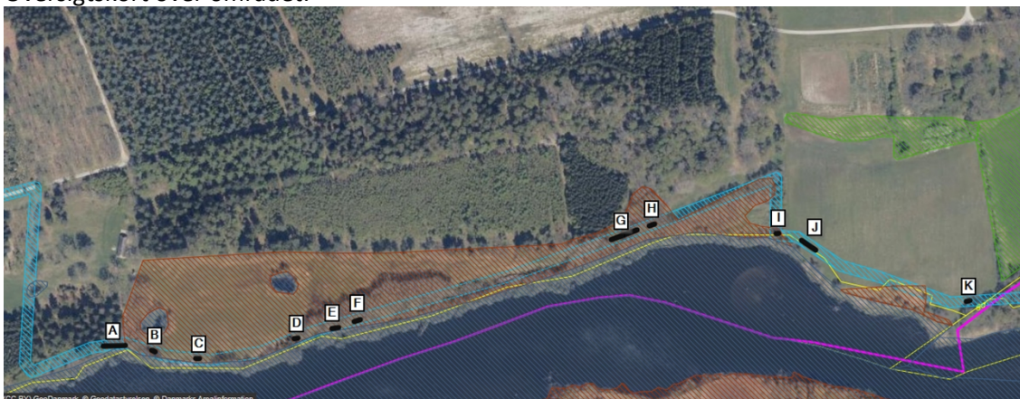
Figur 1: Træstier er markeret med sort og angivet fra A til K. Se desuden oversigtskort i bilag 1.