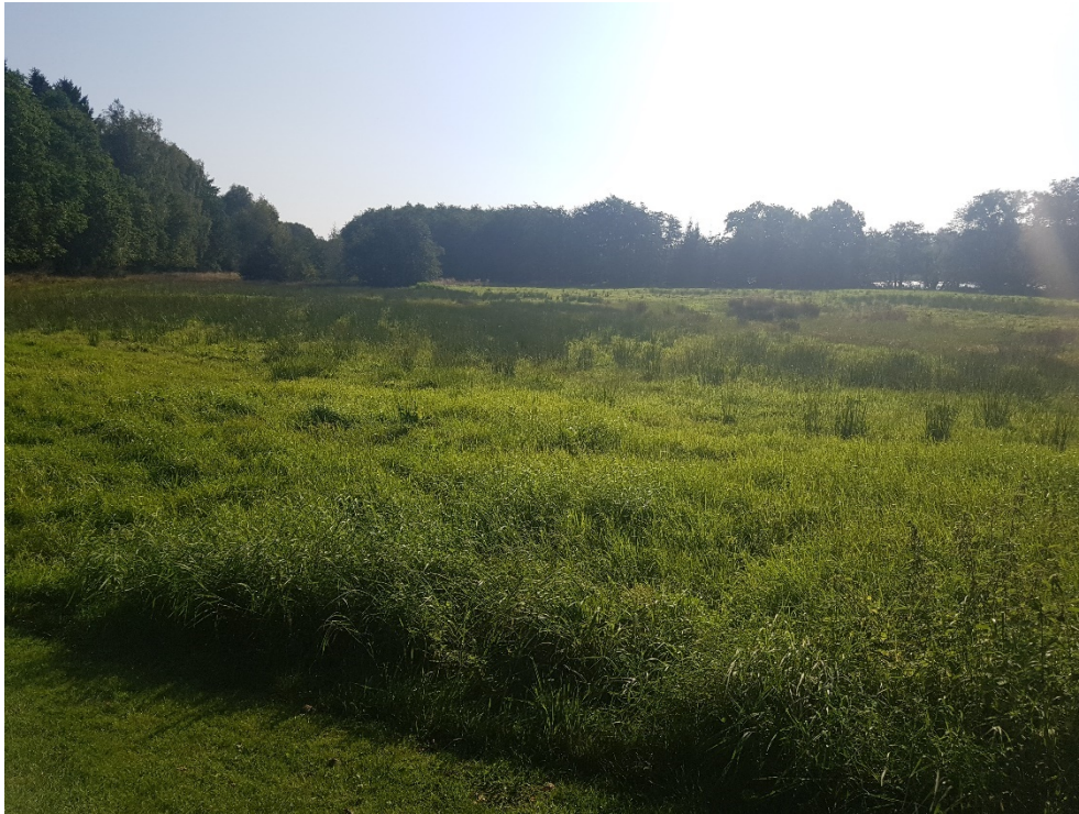
Figur 2: Vestlig del af mosen, der flere steder har eng-karakter.