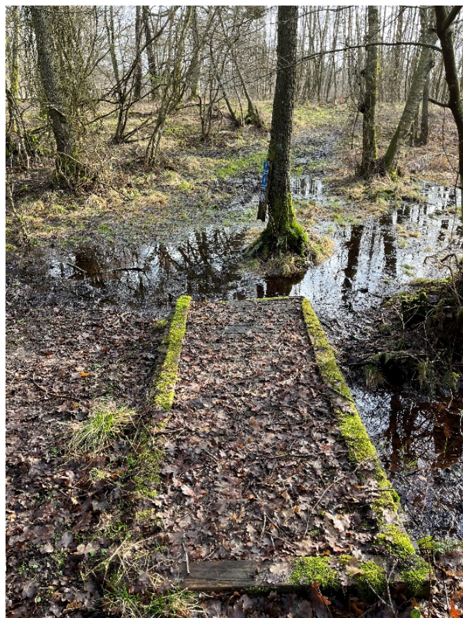
Figur 5: Fra ansøgningen – strækning G