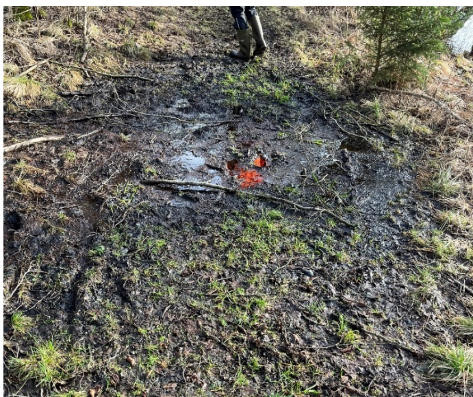
Figur 7: Fra ansøgningen – strækning c