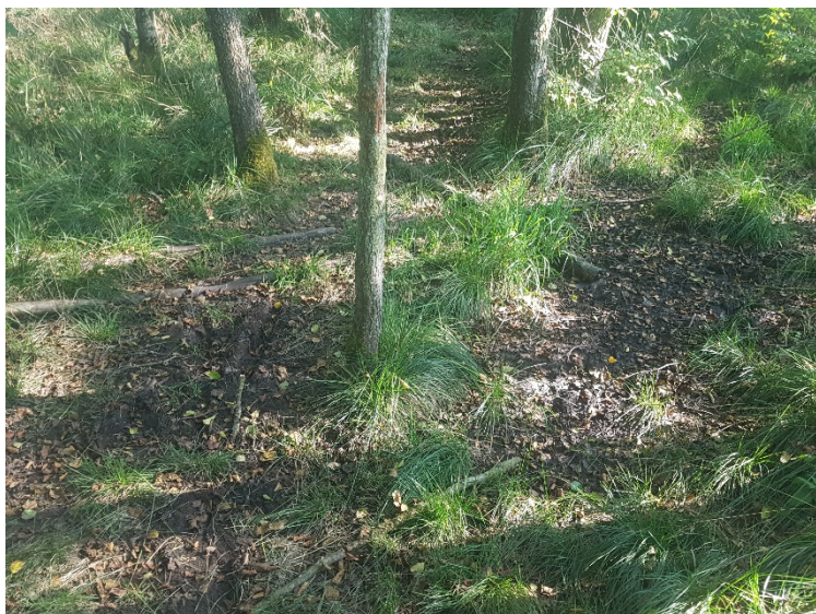
Figur 4: Mosearealet i det skovbevoksede område