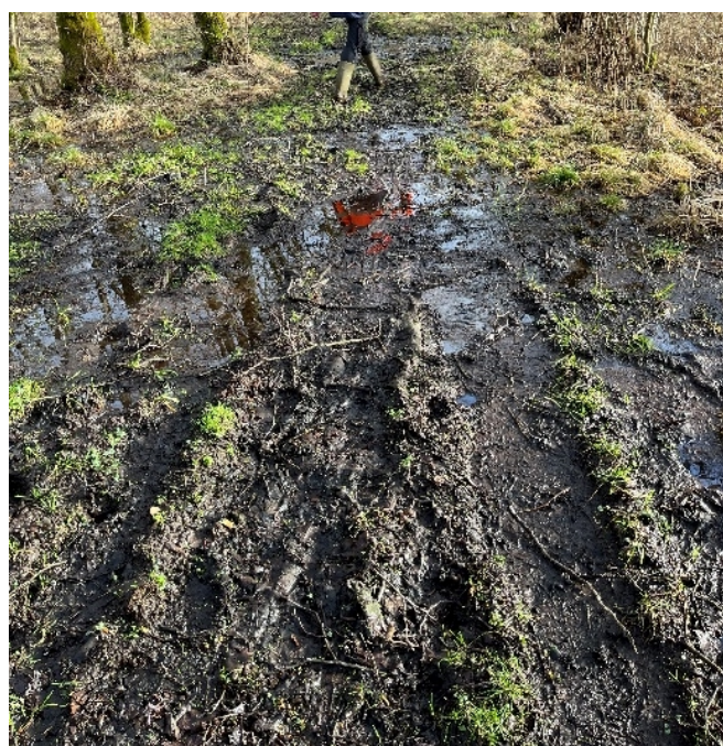
Figur 6: Fra ansøgningen – strækning E