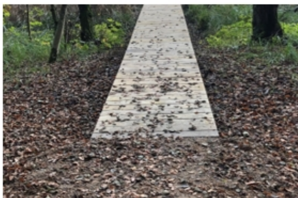
Visualisering af træstieme – der monteres dog blindekant langs begge kanter.