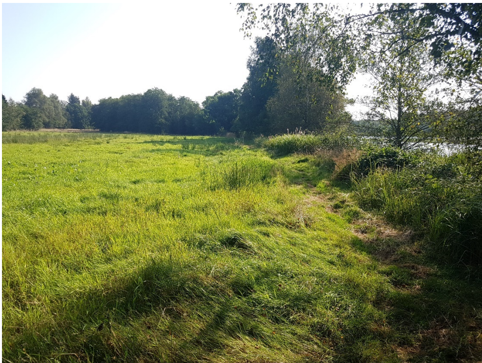
Figur 3: Mosearealet set fra vest. Trapestien ses til højre i billedet.