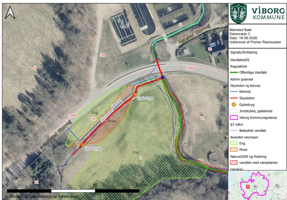
Figur 3: Oversigtskort der viser delområde 3.