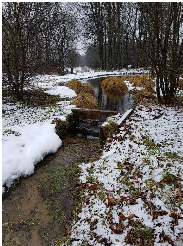
Figur 2. Foto af stemmeværk i tilløb til Borup Møllebæk