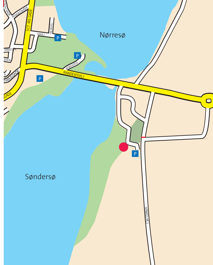
Asmild Klosterhave, Vinkelvej 18A-B, 8800 Viborg

Ved genopbygningen blev kirken reduceret i størrelse. Det tidligere omrids af kirken kan i dag aflæses af det røde farvebånd i granitbelægningen ved kirkens fod.