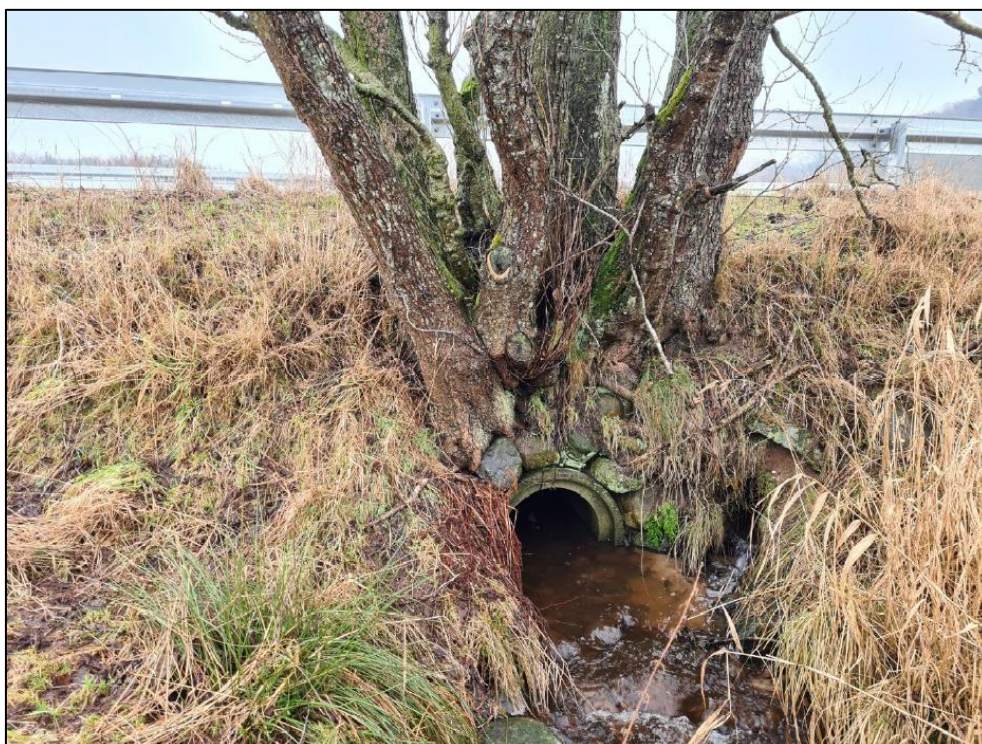
Foto af den vestlige facade af den eksisterende rørunderføring. Billede fra ansøgningsmateriale.