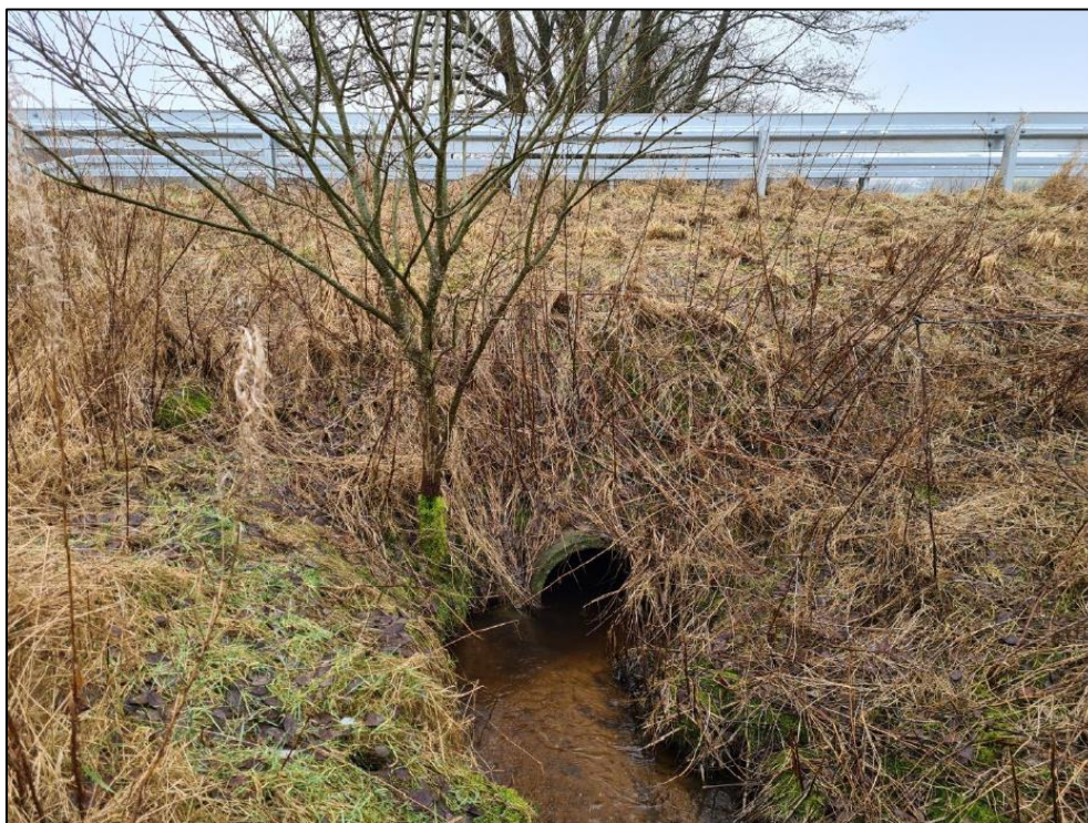
Foto af den østlige facade af den eksisterende rørunderføring. Billede fra ansøgningsmateriale.