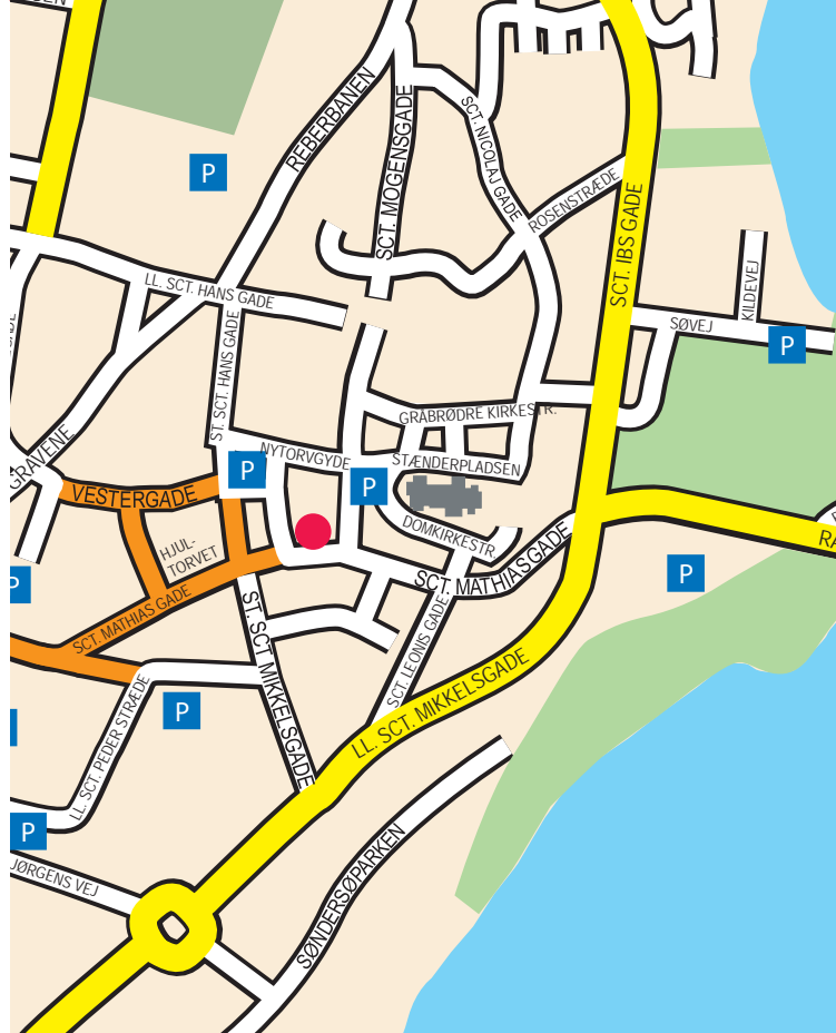
Latinerhaven, Sct. Mogens Gade 1, 8800 Viborg