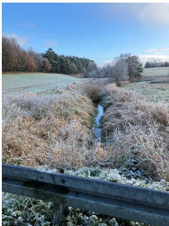
Figur 2: Billede fra Bystævnet og mod øst. Viser vandløbet hvor der gives tilladelse til en kreaturbro.