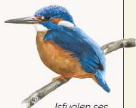
Isfuglen ses hyppigt ved Brostedet.

Hvis du en sen aften hører kraftig plasken i åen, er det måske den sky odder, der fisker i sit revir. Reviret kan dække flere kilometer af åen.