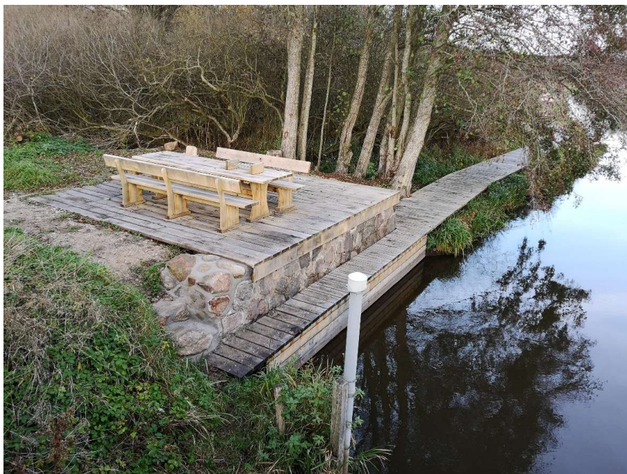
Randers siden - nord