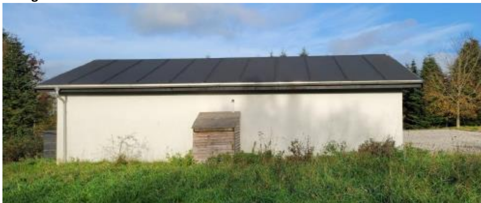
Facade mod syd.