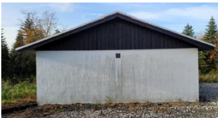
Facade mod øst. Indsendt af ansøger.