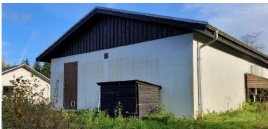
Facade mod vest.