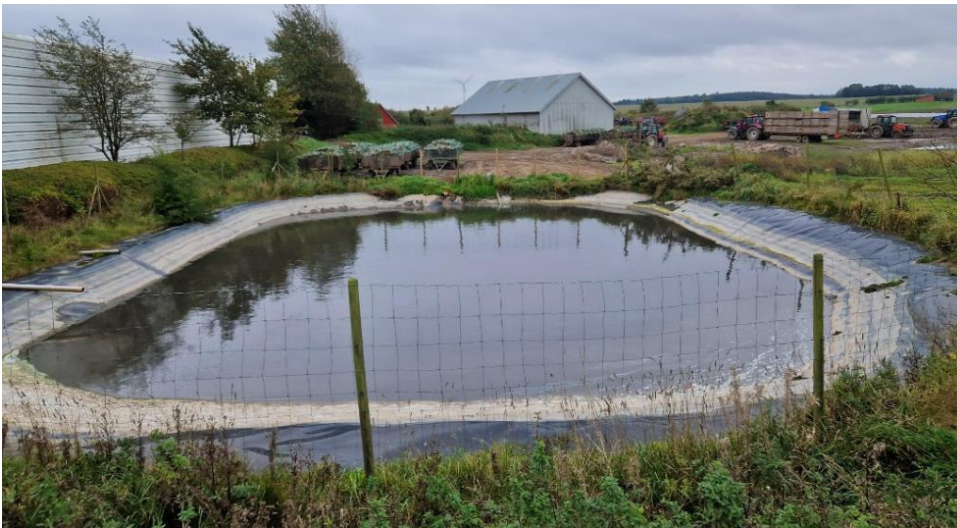
Ansøgers foto af lagune set fra nord.