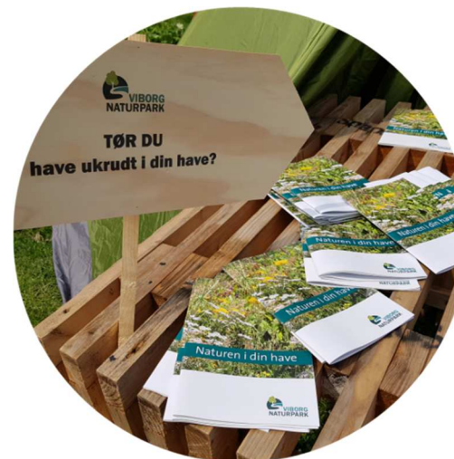
Hæftet: "Naturen i din have"