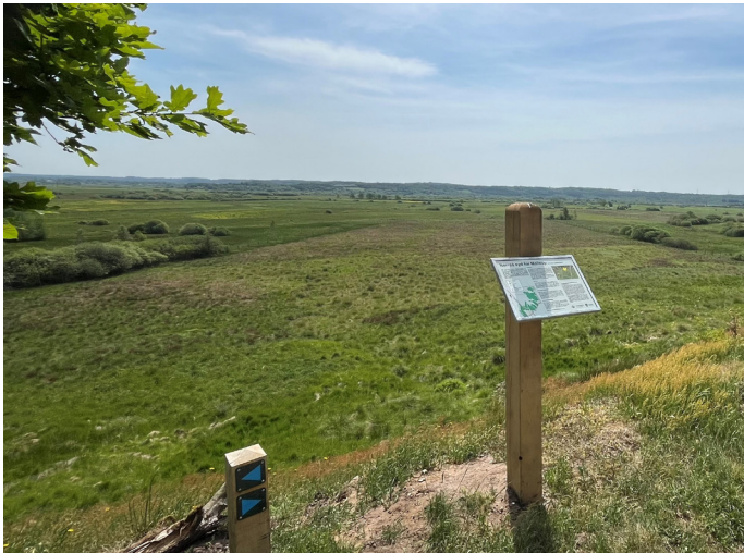
Udsigten fra den nye vandrerute ved Overgårdsvej

Men mens jordfordelingen er afsluttet i klima-lavbundsprojekt Kvorning kører de videre i nye projekter.