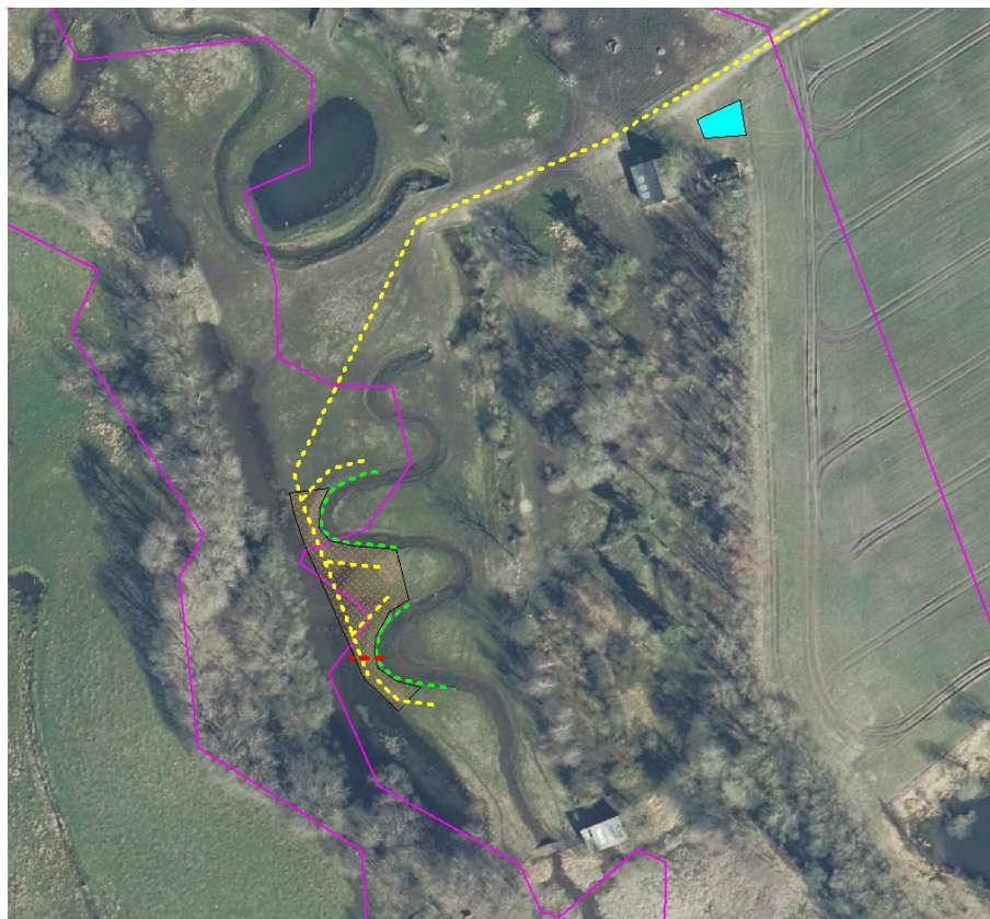
Figur 2: Signaturforklaring: Køreveje (gule streger). Brinsikring (grønne streger). Nødoverløb (rød streg). Materialeoplag (blåt areal). Terrænopfyldning (skraveret område langs vandløb)