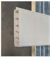
DCS plank hvid

ill. tegning med antal viste spær-beklædningsøjler og afløb kan afvige i forhold til tilbud.